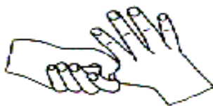
5.拇指在掌中转动搓擦